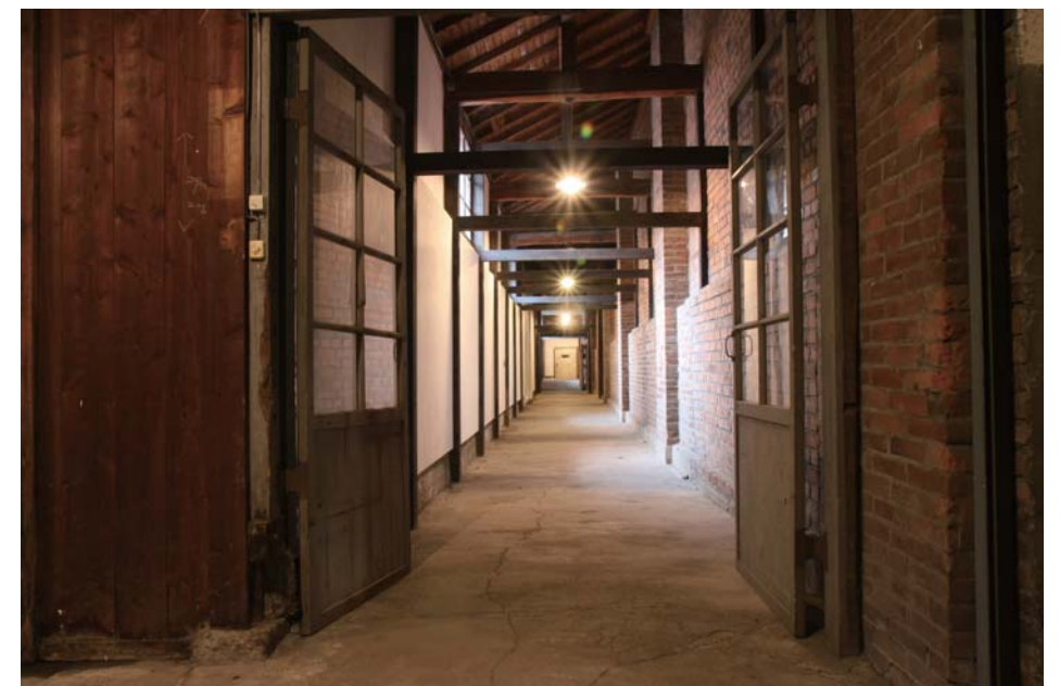
A棟横廊下 1階西側→東側 7-02