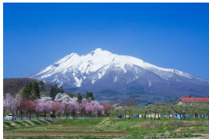
【岩木山を背景に広がるりんご畑と田園風景】