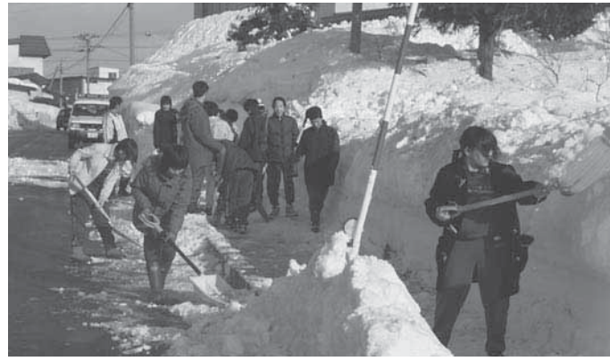
中学生による除雪ボランティア