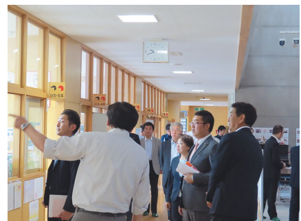
2日目 常盤野小・中学校にて

「ひろさき市議会だより」について、ご意見・ご感想などがありましたら、今後の参考にさせていただきますのでTEL・ファクス・メールなどでお気軽にご連絡ください。