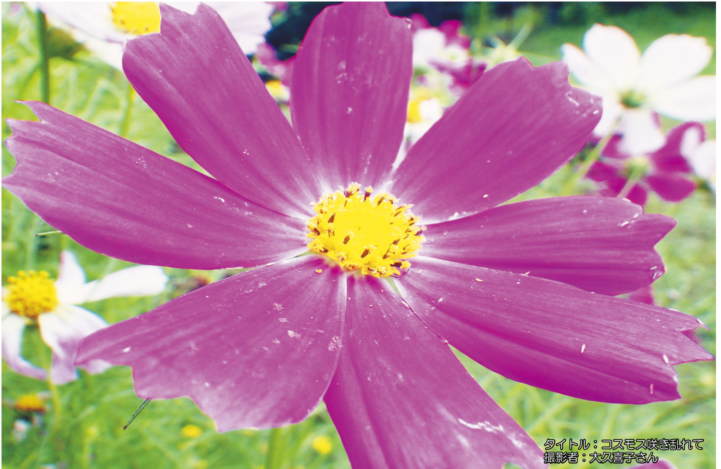
タイトル：コスモス咲き乱れて