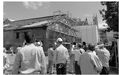
6月28日に行われた弘前れんが倉庫美術館工事状況の見学の様子

令和元年10月1日より3歳から5歳までの幼稚園、保育所、認定こども園などを利用する子供たちの利用料が無償化されます（0歳から2歳までの子供たちは住民税非課税世帯が対象）。これらに伴うシステム改修等を行う事業になります。