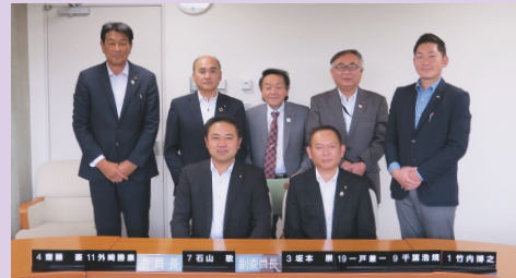
編集会議後に委員全員で