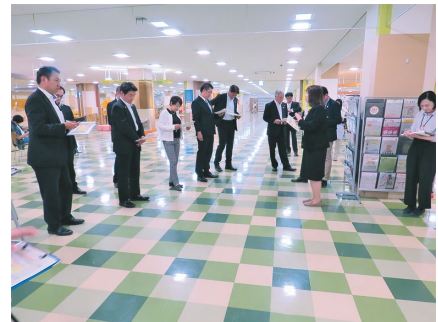
1日目 ヒロロ内にある子育て世代包括支援センターにて