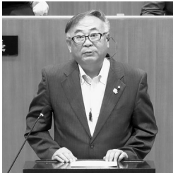
千葉 浩規 (日本共産党)