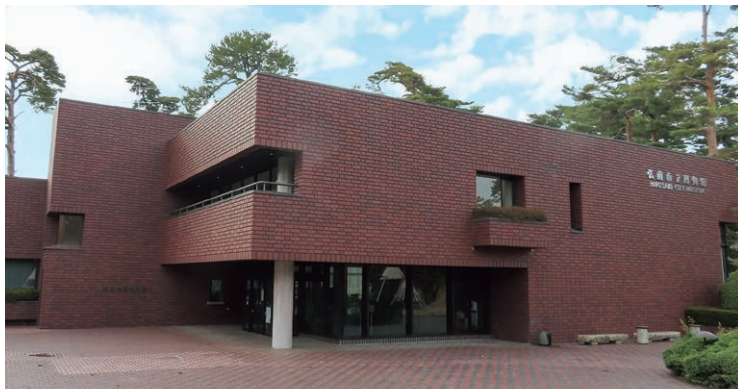
弘前市立博物館外観