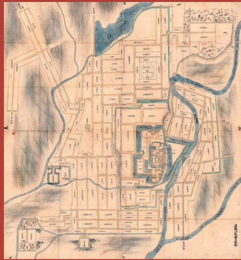
弘前市指定文化財「津軽弘前城之絵図」正保2年(1645)