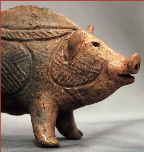
国指定重要文化財「猪形土製品」