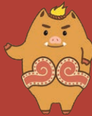
マスコットキャラクター「いのっち」