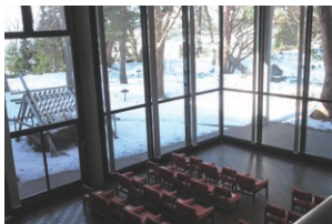
ロビーからの眺め