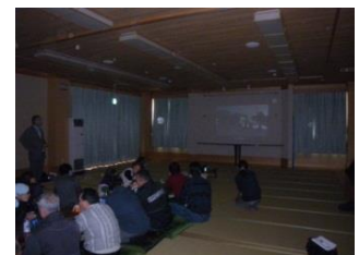
地域で上映会を行いました。