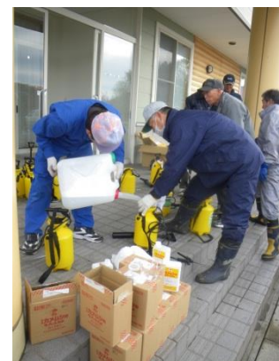
町会役員が噴霧器の使用法や作業の要領を指導