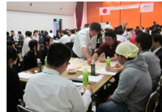
まちづくりについて議論中