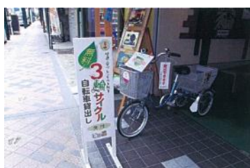
三輪自転車の貸し出し