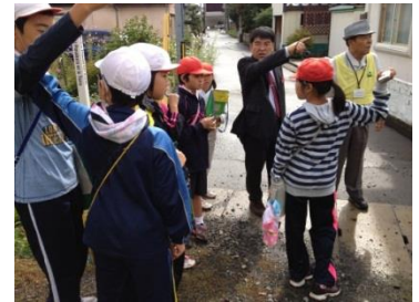
子どもたちが 自ら地域の安全を調査