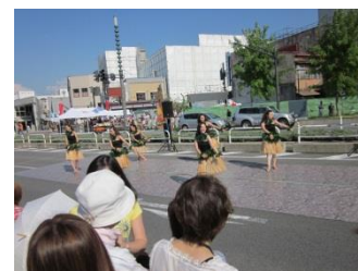
路上でのパフォーマンス