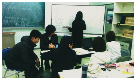
作成するパンフレットについての話し合いを重ねる