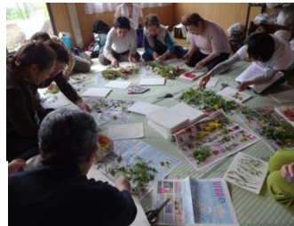
草花でしおりづくり