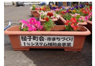
手作りのラミネートでPR