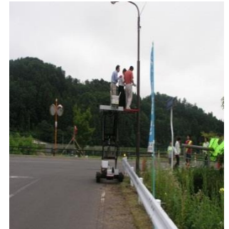
回転灯設置工事中