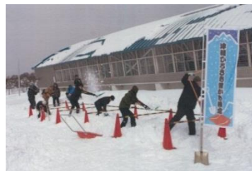
津軽ひろさき雪かき検定