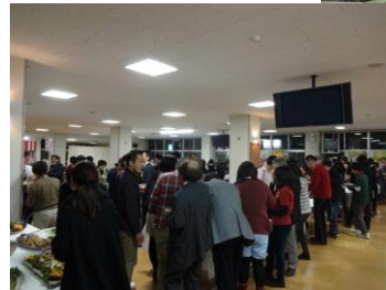
和気あいあいとした 雰囲気の交流会