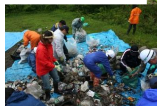
岩木山に捨てられた大量のゴミ