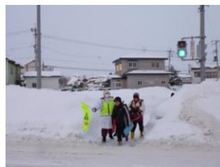
冬休み明けも登校支援