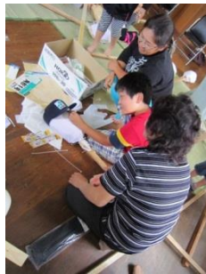
かかしの顔を描く 緊張の瞬間。