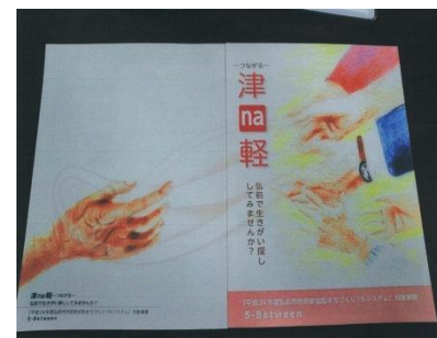
完成したパンフレット