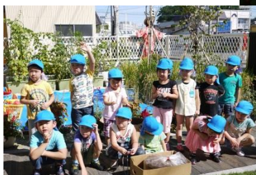
生ごみ堆肥づくりを体験した子どもたち