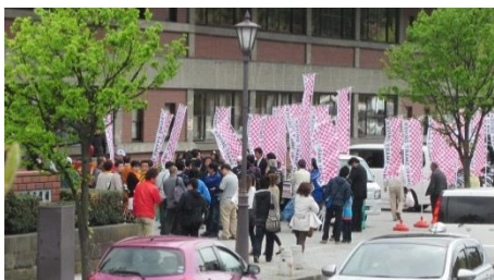
さくらまつりの時期に合わせてステッカーを配布