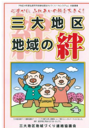
↑ ← 作製された冊子