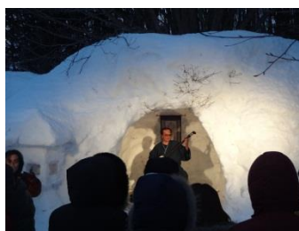
三味線の演奏と語り