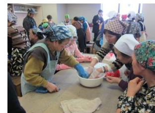
りんごの皮から抽出した液で草木染