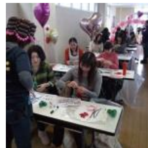
バルーンアートのワークショップ