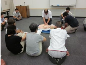
事前に救急救命講習を実施しました