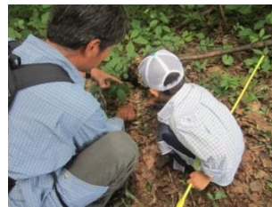
森林インストラクターによる森林・里山の観察