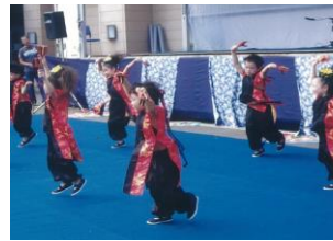
地域の子も達が日頃の成果を発表