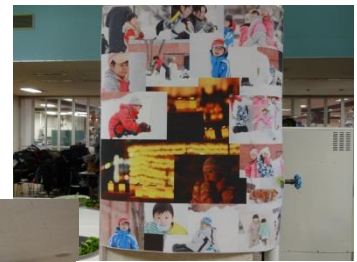
会場に飾られた 子どもたちの写真