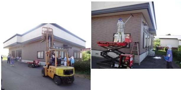
重機を使用しながら町会総出で整備