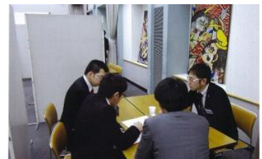
福祉と暮らしの相談会