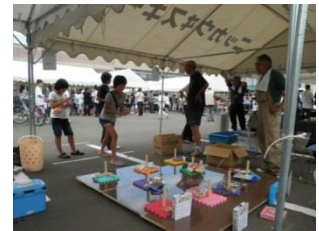
町会青年部員も祭り運営に自主的に参加