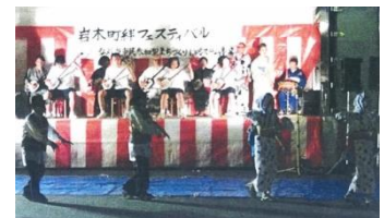
恒例の仮装盆踊り