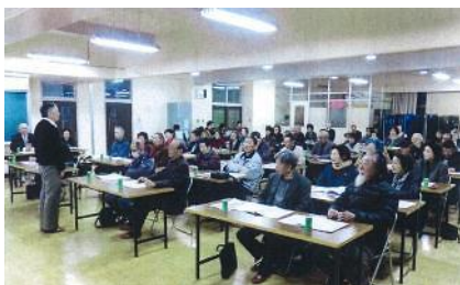
冊子を活用しての研修会