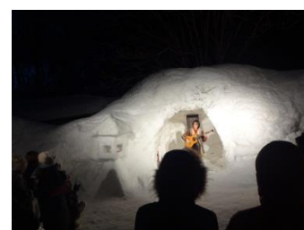
かまくらの中で フラメンコギターの演奏