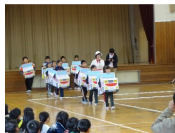
小学校での交通安全運動