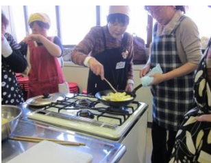
フライパンでできるタルト・タタン！