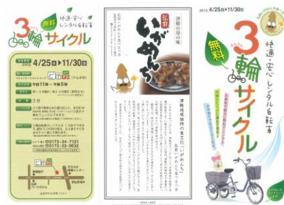
いがめんちマップ