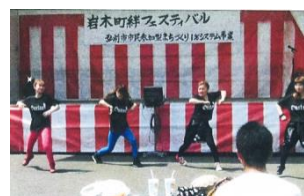
ダンスパフォーマンス