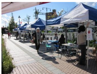
3・3・2号線の歩道に様々な作品が並びました。