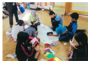
地域安全マップを作成