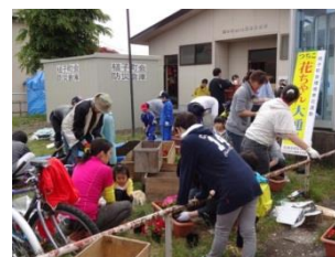
集会所でプランターの準備