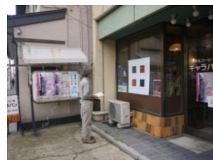
商店街に展示された作品を見ながら歩くアートウォーク