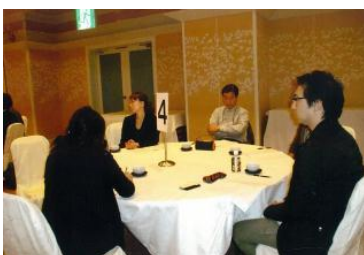
相談援助者対象の研修会