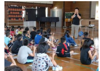
ねぶた囃子講習会