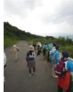
各々のペースで津軽岩木スカイラインをウォーキング