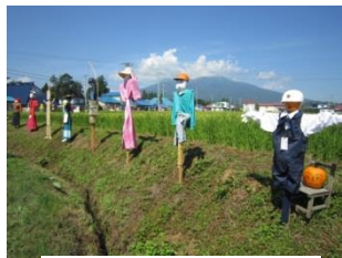
岩木山をバックに 並ぶかかし