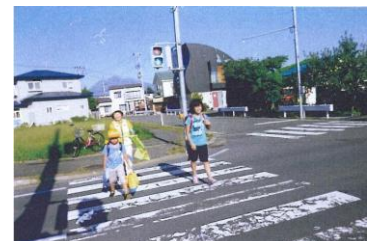
夏休み明けの登校支援