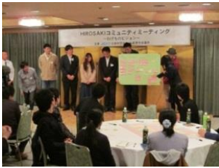
議論の成果を発表