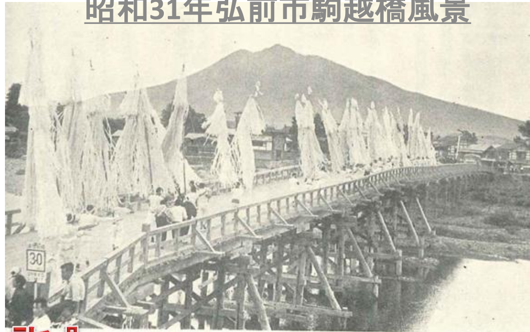
昭和31年弘前市駒越橋風景