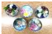
みつろう 蜜蝋缶完成イメージ