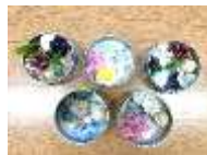
蜜燻缶完成イメージ