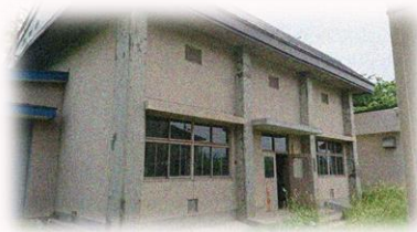
常盤坂増圧ポンプ場(S46年)