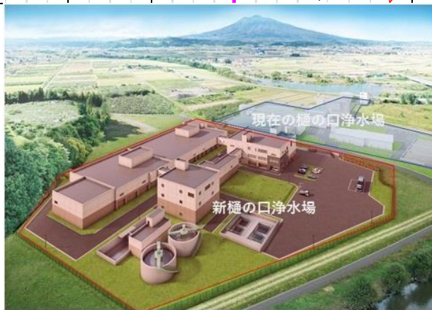
※新樋の口浄水場 完成予想図