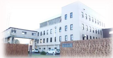
樋の口浄水場(S35年・S45年)