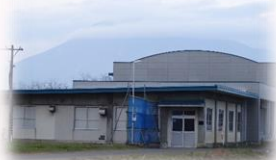
岩木川取水ポンプ場(S52年)