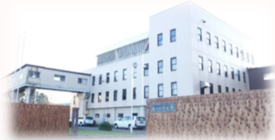
樋の口浄水場(S35年・S45年)