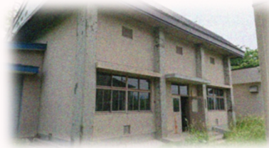
常盤坂増圧ポンプ場(S46年)