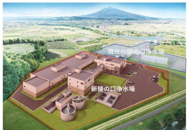
※新樋の口浄水場 完成予想図