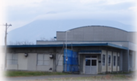
岩木川取水ポンプ場(S52年)