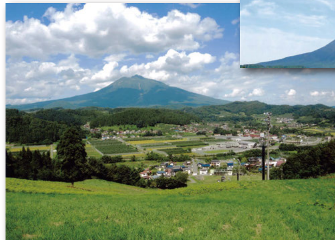
そうまロマンチックピアスキー場(P.11-12)