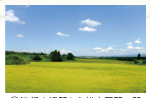
②津軽大沢駅から松木平駅の間 住宅街を抜けると広がる田園風景。「大鰐線は電車の速度が風景を楽しむのにちょうどよい」という声も。