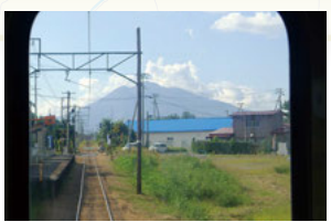
③小栗山駅 線路の先にそびえ立つ岩木山。麓まで電車で行けたらいいのに、なんて思ってしまいます…

弘 前市と大鰐町を結ぶ弘南鉄道大鰐線の車窓からも、田園風景や岩木山など、弘前らしくどこかノスタルジックな風景を楽しむことができます。ゆっくり流れる時間を弘前の風景と共に過ごしてみませんか？