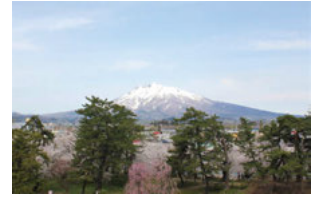
30 弘前城本丸からの岩木山