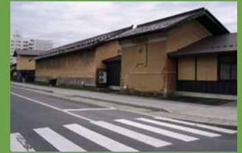
16 津軽藩ねぶた村 (蔵) [亀甲町 61 慶応元年 (1865 年) 建築] 藩の米蔵として建てられ、後に小学校の校舎や味噌蔵としても活用された土蔵は、現在では津軽塗やごぎん刺し、弘前こけし、津軽焼、津軽凧など弘前の民芸品の工房として活用されています。