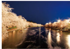
27 春陽橋からの西濠