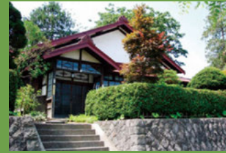
15 竹田家住宅 [下白銀町 15 大正 6 年建築] 江戸時代に同地にあったとされる武家住宅の形式を受け継いでいる古色を残した建物です。