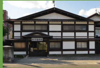
13 石場旅館 [元寺町 55 明治 12 年建築] 登録有形文化財。黒塗りの付け梁と白い漆喰壁が、城下町弘前の風情を醸し出している老舗の旅館です。