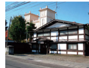
石場旅館と ● 日本基督教団弘前教会 (県重宝)