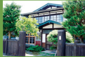
14 旧杉山醫院 [百石町小路 3 明治期建築] 明治期に建てられた母屋に、昭和 20 年代に増築された医院部分とともに創業当時の姿がよく残されている建物です。現在は和の建物を生かした北欧家具店として活用されています。