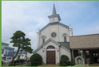
11 カトリック弘前教会 [百石町小路 20 明治 43 年建築] 堀江佐吉の弟、横山常吉が施工した尖塔をもつロマネスク様式の木造建築。神の救いの歴史を表現したステンドグラスが美しい彩を添えています。