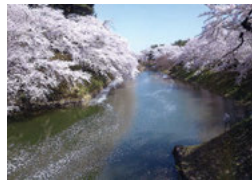
28 杉の大橋からの中濠