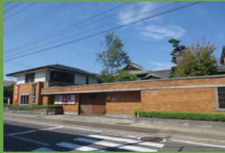
12 翠明荘 (旧高谷家別邸) [元寺町 69 昭和 8 年建築] 登録有形文化財。青森銀行頭取を務めた高谷英城の別邸。総檜・入り母屋造りの建物のほか、洋館は旧帝国ホテル「ライト館」風の建物となっています。