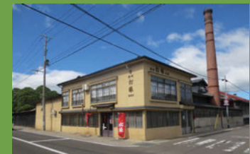
20 (株) 松緑酒造 [駒越町 58 江戸時代後期建築] 黒板塙とそこから見える松の姿や、煉瓦の煙突がシンボルとなっている造酒屋です。