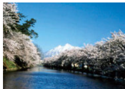
26 外濠と岩木山 (津軽藩ねぶた村前)