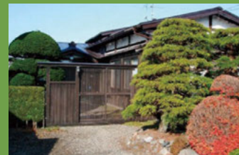
19 工藤家住宅 [五十石町 30 江戸期建築] 枯山水の形式を取り入れた前庭や門構えなどから藩政時代の雰囲気醸し出されています。