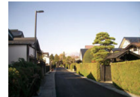
25 仲町伝統的建造物群保存地区