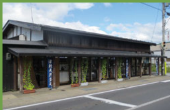
17 川崎染工場 [亀甲町 63 1800 年頃建築] 寛政時代に創業した天然藍染めの染物屋。藩政時代の風情を醸し出しています。