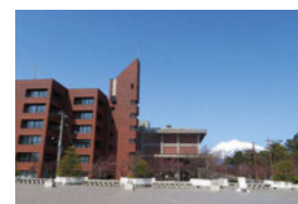
(N) 追手門広場からの ● 弘前市庁舎