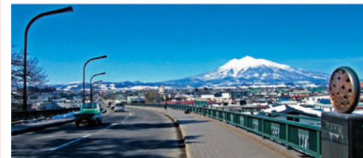
(P) 城西大橋からの岩木山