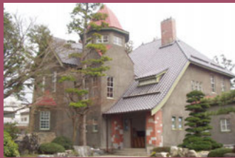
22 旧藤田家別邸 [上白銀町8-1 大正10年建築] 登録有形文化財。洋館は、日本商工会議所会頭をつとめた弘前市出身の藤田謙一の別邸。大正ロマン溢れる建物です。