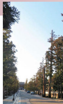
(O) 禅林街(国指定史跡)