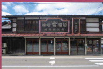
27 加藤味噌醤油醸造元 [新寺町153 明治4年建築] 創業当時のたたずまいを残した建物。ここでは昔ながらの製法で津軽の味噌と醤油の味が守り続けられています。加藤坂(通称)からの風景は、どこか懐かしささえ感じられます。