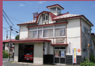
24 茂森会館消防西第一分団 [西茂森1丁目1 昭和11年建築] 禅林街入口の枳形に位置し、望楼付きの洋風デザインが目目を惹く建物です。