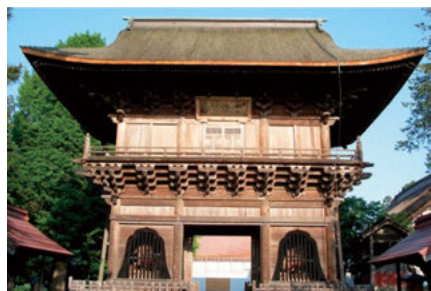
● 長勝寺三門(重要文化財)