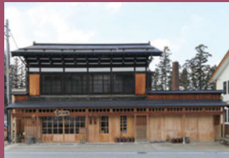
23 酒舗 成豊 [茂森町83 昭和7年建築] 禅林街の門前町、また相馬・目屋地区の街道沿いの町家。当時を感じさせる建物で、地酒も多く取り扱う老舗の酒店です。