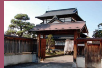
25 下山家住宅 [茂森新町3丁目1-3 昭和20年建築] 正面玄関側に切妻型の大きな屋根、白漆喰の妻壁に格子状の梁や束が美しい「吾妻建ち」の特徴を残した建物です。