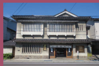
30 大阪屋 [本町20 昭和28年頃建築] 寛永7年(1630年)創業の老舗の和菓子店。津軽藩の御用菓子司として代々受け継ぎ、現在は13代目です。