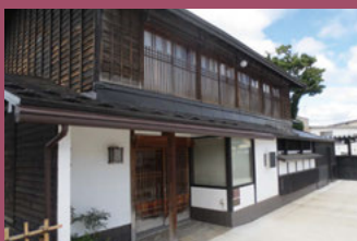
28 旧町田家住宅 [新寺町129 明治末期建築] 明治時代の旧商家。寺院街の町並みに溶け込んで落ち着いた雰囲気を感じさせています。