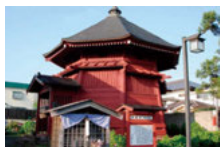
● 栄螺堂(市指定文化財)