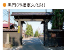
● 黒門(市指定文化財)