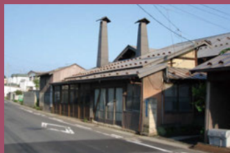
26 田澤刃物製作所(清水一國) [茂森新町2丁目3-11 昭和5年建築] 創業当時のたたずまいを残した建物。「清水一國」印のりんご剪定鋏は、全国の果樹生産者に愛用されている津軽打刃物店です。