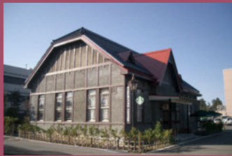
21 旧第八師団長官舎(弘前市長官舎) [上白銀町1-1 大正6年建築] 登録有形文化財。堀江佐吉の長男、堀江彦三郎の設計。大正時代の洋風高級住宅を彷彿させる建物です。現在はコーヒーストアとして活用された新たな観光スポットになっています。