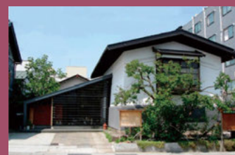
31 御料理 なる海 [本町34 天保4年(1833年)建築] 質屋として建築された蔵は、明治時代には銀行の金庫蔵として活用され、現在では、人気の懐石料理店となっています。