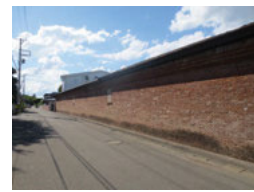
弘前銘醸煉瓦倉庫 (趣のある建物)