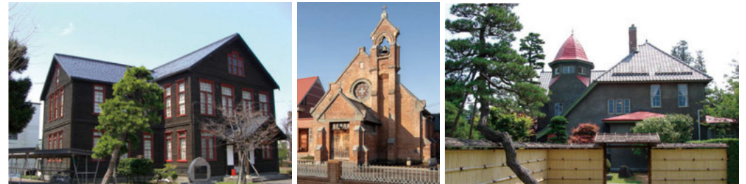
左. 鏡ヶ丘記念館(県重宝) 中. 日本聖公会弘前昇天教会(県重宝) J・M・ガーディナー設計 右. 藤田家別邸洋館(登録有形文化財、趣のある建物)