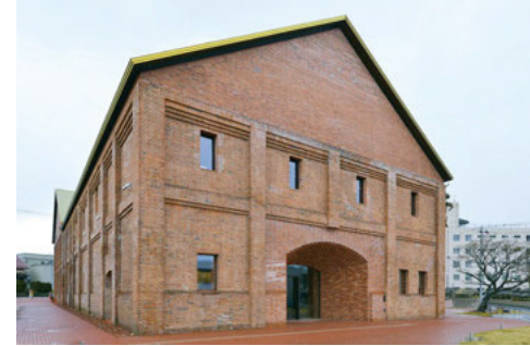
弘前れんが倉庫美術館