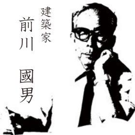
建築家 前川 國男

近代建築の巨匠ル・コルビュジエのもとで学んだ前川國男は、パリから帰国後、処女作といわれる「木村産業研究所」を手始めに、「弘前中央高校講堂」や「弘前市庁舎」など、数多くの公共建築を弘前で手がけました。 初期から晩年までの8つの作品が残る前川建築巡りは、日本の近代建築の歩みを辿ることにもなります。