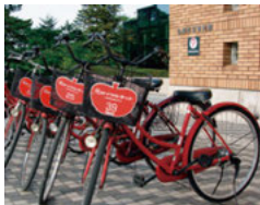
※2024年3月時点の内容です。