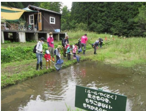
水辺コーナーに到着