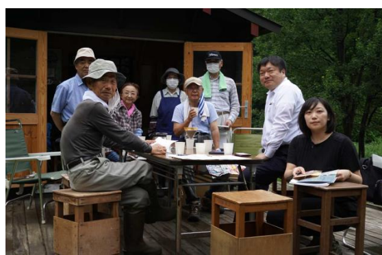
小沢小学校だんぶり池観察会