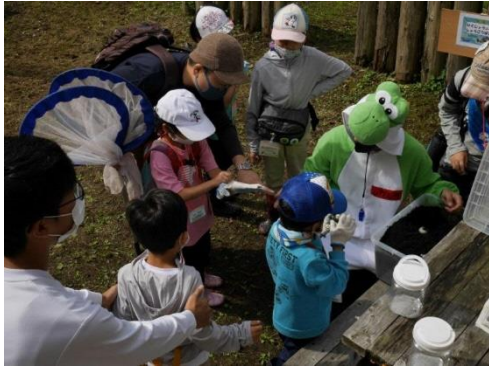
カブトムシ幼虫を無償配布