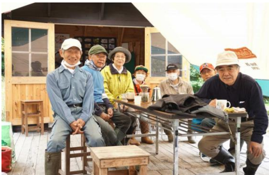
10月13日だんぶり池作業