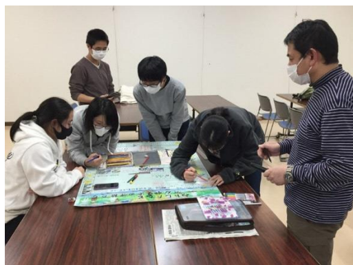
1月6日壁新聞づくり