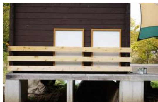
観察小屋掲示板雪囲い