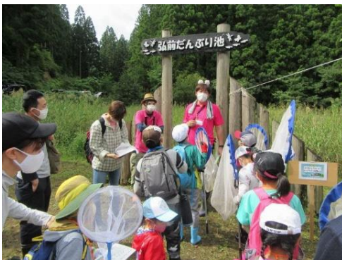
陸上コーナーへ出発