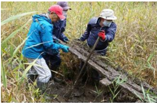
10月24日だんぶり池作業