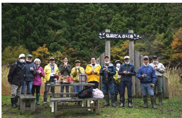
だんぶり池作業納め