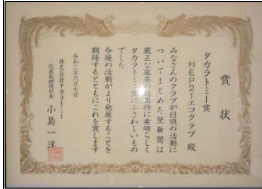
エコクラブ タカラトミー賞表彰状