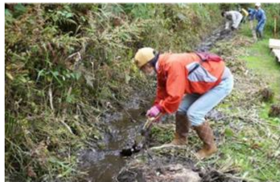
津軽堰泥上げ作業