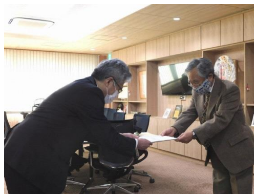
第三次弘前市環境基本計画の答申