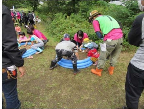
土器発掘コーナー