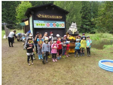
たか丸くんと記念撮影