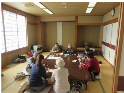
第二回だんぶりカレンダー制作