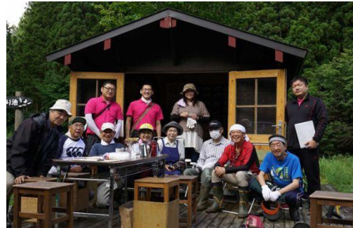
弘前青年会議所だんぶり池打合せ