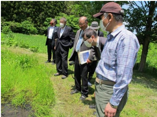
水環境学会だんぶり池視察