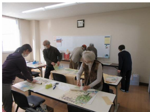
だんぶりカレンダー送付作業