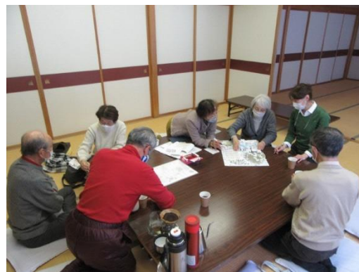
第三回だんぶりカレンダー制作