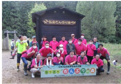
青年会議所スタッフ