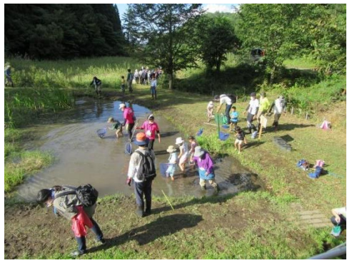
池に入って泥んこになって採集