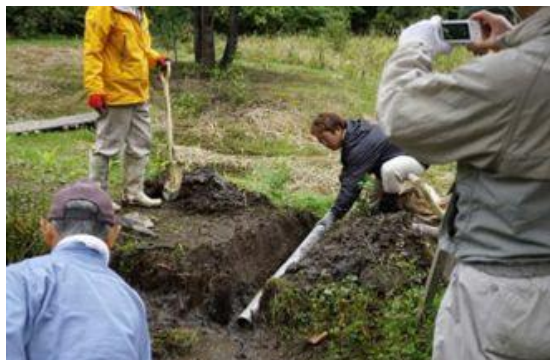
カナコ菴水抜管取替作業