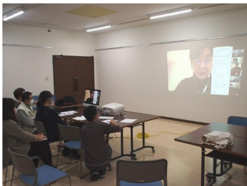
エコクラブオンライン交流会