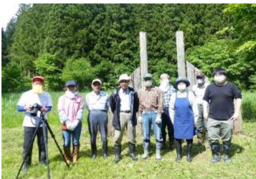
だんぶり池臨時作業