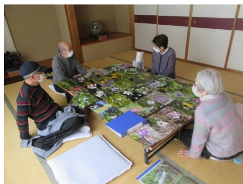
だんぶり池動植物写真記録資料作成