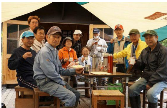
10月8日だんぶり池作業