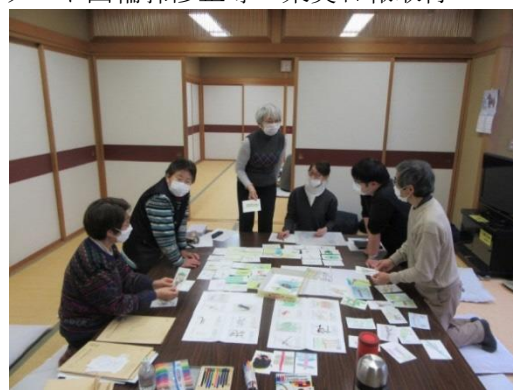
第一回だんぶり池カレンダー制作