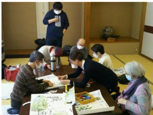
だんぶりカレンダー初校正