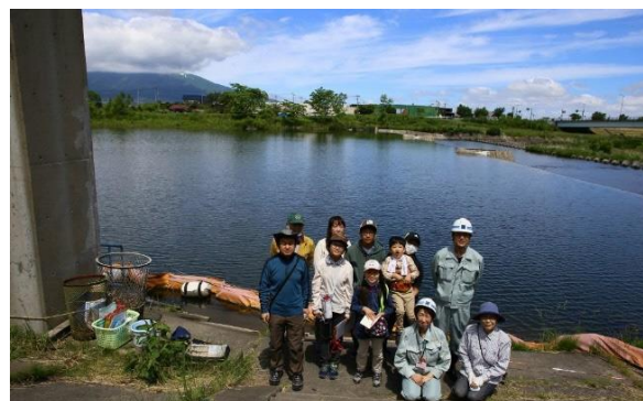
身近な水環境の全国一斉調査