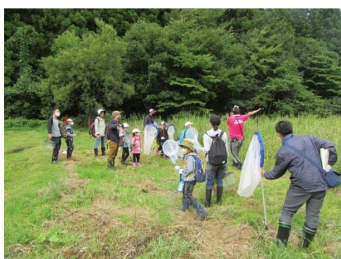
陸上コーナーへ到着・採集開始