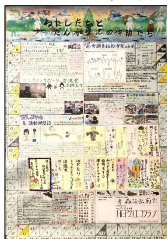
エコクラブ 壁新聞完成