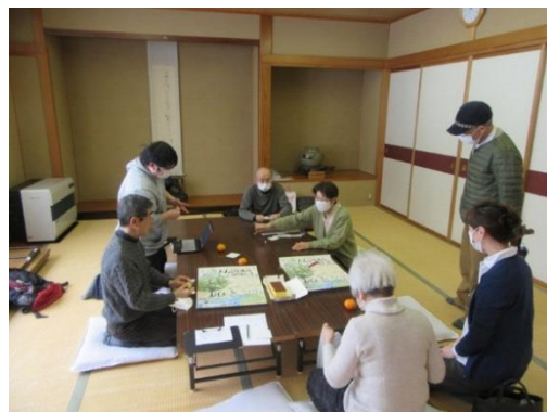
だんぶりカレンダー第二校正