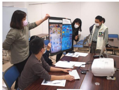
エコクラブオンライン交流会