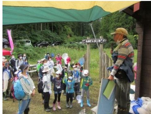
鶴見代表挨拶・説明