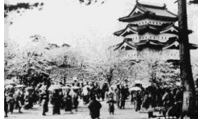
大正期のさくらまつり