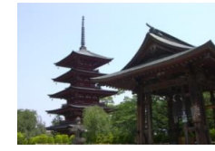
さいしょういん 最勝院五重塔

当市に多く残る寺社の祭礼として行われる宵宮は、夏の風物詩として定着しており、関連して行われる津軽獅子舞などの伝統芸能が受け継がれています。