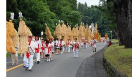
ひゃくざわ 百沢街道の松並木と参拝者