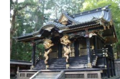
いわきやま 岩木山神社

お山参詣は、津軽の人々にとってかけがえのないシンボルである岩木山に対する民間信仰行事で、国の無形民俗文化財に指定されています。