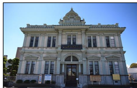
旧第五十九銀行本店本館

明治37年(1904)に旧第五十九銀行の本店として建てられ、設計・施工は堀江佐吉によるものである。正面に展望台を兼ねた屋根窓、屋根周囲にバラストレードを設けるなど、外観はルネサンス風の意匠を基本としているが、土蔵と同じように壁を漆喰で塗籠めた防火構造で、和洋折衷手法の優れた明治建築である。