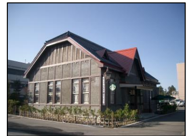
旧第八師団長官舎 (登録有形文化財)

保存修理事業を実施する建造物等は、施工中の一般公開や屋根葺き、土壁塗り、木材の削り方など職人による伝統技法の実演などの公開を推進する。