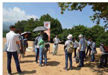
じょうもん祭り遺跡探検隊 (大森勝山遺跡)

その他、史跡公園としての公開を目指して整備工事を実施している、史跡津軽氏城跡堀越城跡や史跡大森勝山遺跡では、整備現場を市民に公開して整備状況を広く周知するとともに、史跡に親しんでもらえるように史跡を舞台としたイベント等を開催している。