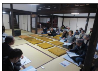
保存計画見直しに係る住民説明会