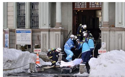
文化財防火デーの様子

文化庁・消防庁が位置付けている1月26日の文化財防火デーにあわせ、毎年市内の指定文化財建造物において防災訓練を行っており、今後も継続する。