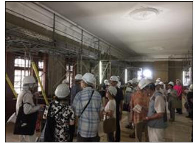
旧弘前偕行社修理現場公開