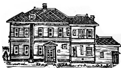
旧東奥義塾外人教師館