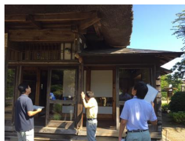
文化財パトロールの様子

国及び県が指定する文化財において修理が必要となった場合は、国の指定文化財は、文化庁と青森県教育委員会の指導の下、県の指定文化財は青森県教育委員会の指導の下、所有者と協議の上で修理計画を作成し、適正な維持のための修理を実施する。建造物については、