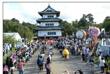
弘前城天守曳家イベント

また、本丸石垣修理にあわせて埋め立てた内濠を市民や観光客に開放することや、天守曳家にあわせて大規模なイベントを実施するなど、文化財の魅力を広く発信している。今後も、市のシンボルである弘前城跡の大規模な整備について情報発信を継続し、多くの人々に文化財に親しむ機会を提供していく。