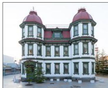
旧弘前市立図書館

旧弘前市立図書館は、弘前を代表する明治の洋風建築の一つであり、弘前城南東部の追手門広場に立地する。近年、屋根飾りが落下するなど、屋根周りを中心に老朽化が進み、雨漏れが頻繁に起きるなど、文化財建造物としての価値の喪失につながるような状況にあったことから令和2年度に屋根の葺き替え等を実施した。今後も文化財建造物の健全性を確保し、適正に管理を進めていくことを目指す。