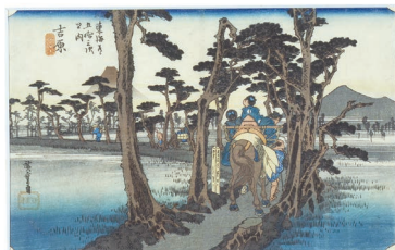
▲歌川広重「吉原宿 左富士」(保永堂版)

なかでも丸清(まるせい)版は残存数が少なく、本展覧会は保永堂版と丸清版が一堂に会する非常にまれな機会ですので、ぜひご覧ください。