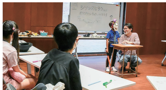
5月28日 弘前れんが倉庫美術館 (吉野町)