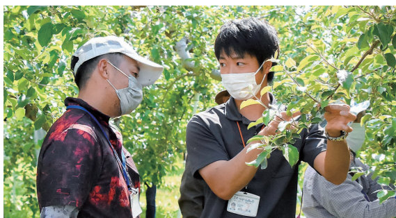
6月1日 りんご公園 (清水富田字寺沢)

摘 果は、果実の肥大促進や品質向上のために、不要な実を摘み取る作業です。参加した27人は、実際に作業を体験しながら講師の話に熱心に耳を傾け、摘果への理解を深めていました。