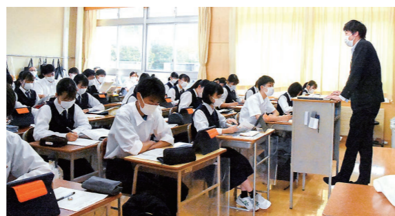
6月9日 弘前南高校 (大開4丁目)

市 の取り組みなどを学ぶ出前講座を、生徒265人が受講。都市計画に関する講座では、タブレットで「ひろさき便利まっぷ」を見ながら、コンパクトなまちづくりについて学んでいました。