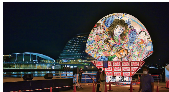
6月3日～5日 神戸ハーバーランド (兵庫県神戸市)

弘 前と琴平の高校生が制作した組ねぶたや高さ約8mの大型ねぶたが、ねぶた囃子とともに琴平の町を練り歩きました。巨大な扇ねぶたの迫力に、詰め掛けた人は大きな拍手を送っていました。