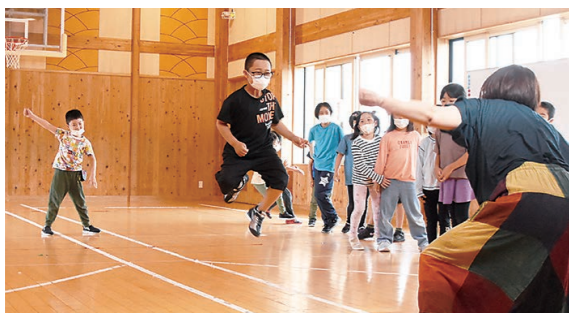
5月23日 岩木児童センター (五代字田屋敷)

遊 びと学びをつなぐ演劇ワークショップに岩木地区の児童が参加。「まほうのなわとび」では、縄を回す動きに合わせてジャンプ! 想像力と表現力を働かせて、元気いっぱい体を動かしていました。