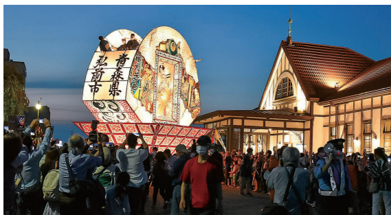
5月28日 香川県琴平町

弘 前と琴平の高校生が制作した組ねぶたや高さ約8mの大型ねぶたが、ねぶた囃子とともに琴平の町を練り歩きました。巨大な扇ねぶたの迫力に、詰め掛けた人は大きな拍手を送っていました。