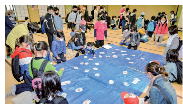
11月3日 中央公民館岩木館（賀田1丁目）ほか

3 年ぶりに開催したイベントには、市内の中学生と高校生が実行委員として運営に参加。ダンスなどの舞台発表、さまざまなゲームや体験ができるコーナー等に、たくさんの方が訪れていました。