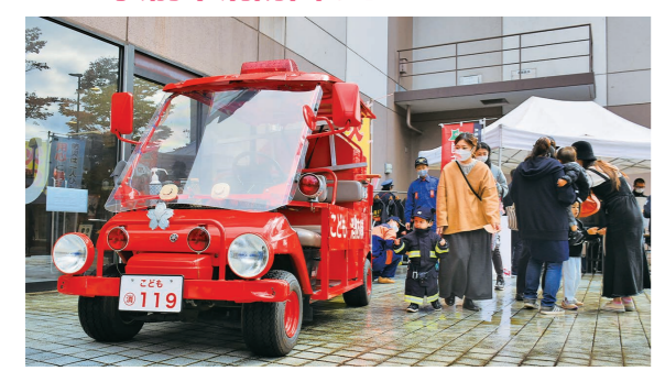
10月30日 駅前公園（駅前町）ほか

消 防団の活動等を知ってもらうためにフェアを開催。消防団車両に乗って記念撮影をしたり、消防団員の気分になって消火体験をしたりして、家族連れなどが日頃の防災意識を高めていました。