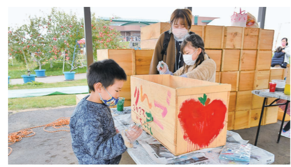
11月5日・6日 りんご公園（清水富田字寺沢）

秋 のりんご公園に2日間で約4,300人が来場。オリジナルりんご木箱やリースを作ったり、りんごを使ったオリジナルフードを味わったりする家族連れなどでにぎわっていました。