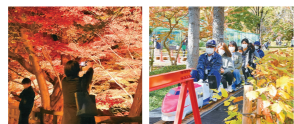
10月28日～11月6日 弘前城植物園（弘前公園内）

紅 葉やフラワーアートで彩られた会場に、まつり期間中に約4万3,000人が来場し、弘前の秋の深まりを堪能していました。夜はプロジェクションマッピングや紅葉特別ライトアップなどのさまざまな光の演出が、来園者を魅していました。