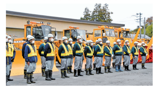
11月4日 市道路維持課（茜町2丁目）

こ れから迎える本格的な降雪シーズンを目前に控え、道路などの除排雪作業への士気を高めました。道路維持課に勢ぞろいした黄色の除雪作業車が、皆さんの冬の生活を守ります。