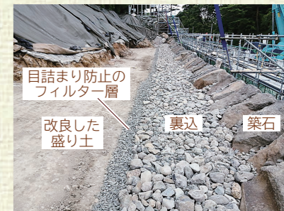
▲石垣一段の仕上がり状況(※2)

新たな湧き水は、地山が見えている今のタイミングでなければ確認できなかったため、今後の石垣を左右する大きな発見となりました。