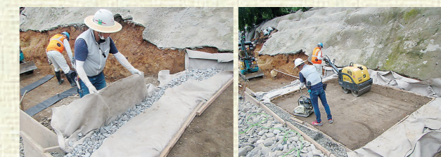
▲湧き水対策設置状況(暗渠〈あんきょ〉排水)(※3)

令和5年度からは、いよいよ重要文化財・弘前城天守が載る南側工区の積み直しに着手します。南側工区は、北側工区と築石の積み方が異なるほか、天守台部分の高さ修正が必要となるなど、より難しい工事になることから、引き続き慎重かつ丁寧な工事を行います。