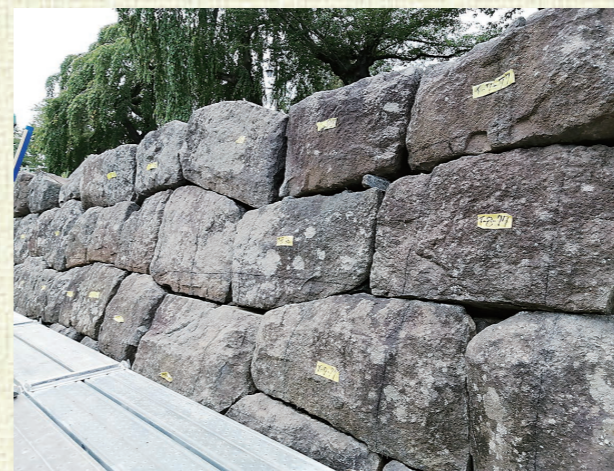
▲「割石の布積」で積まれた元禄期の石垣(※1)

築石(つきいし)一つを積み直すためには、周囲の築石も一度仮置きした上で、石の向きや角度、石同士が接する部分を調整する必要があることから、一つの石を仕上げるのに数石の移動が伴います。このため、一段積み直すのには15～20日程度の期間を必要とし、現在までに約910石の積み直しが完了しました。この範囲は、元禄期(1694～1699年)の石垣とそれらを大正4年(1915年)に積み直した石垣で構成されており、粗く方形に加工した石を横目地が通るように積む「割石の布積」といわれる積み方となっています(※1)。