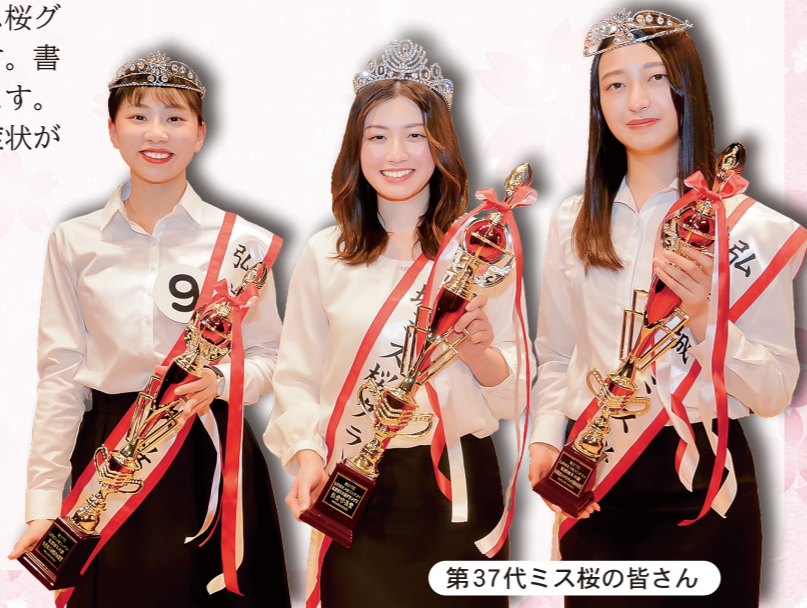
第37代ミス桜の皆さん

※コンテストは、新型コロナウイルス感染症の感染拡大防止対策を講じた上で実施しますので、来場者にご協力をお願いします／観覧者が多数の場合、入場を制限する場合があります／感染拡大状況により、イベントの内容は予告なく中止または変更する場合があります。