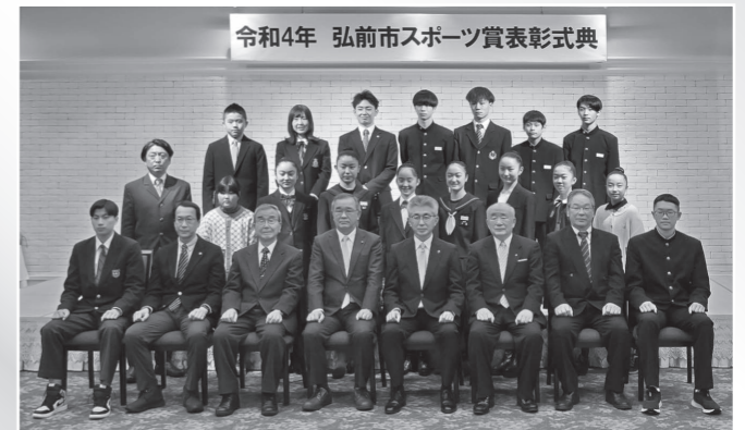
▲スポーツ功労賞、スポーツ大賞を受賞した皆さん