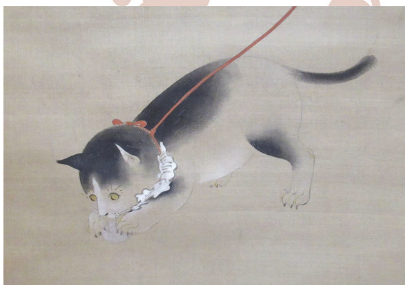
▲狩野雅信筆「翠簾戯猫之図 (みすたわむれるねこのず)」(市立博物館蔵)

■問い合わせ先 高岡の森弘前藩歴史館 (高岡字獅子沢、☎ 83-3110、毎月第3月曜日は休み)