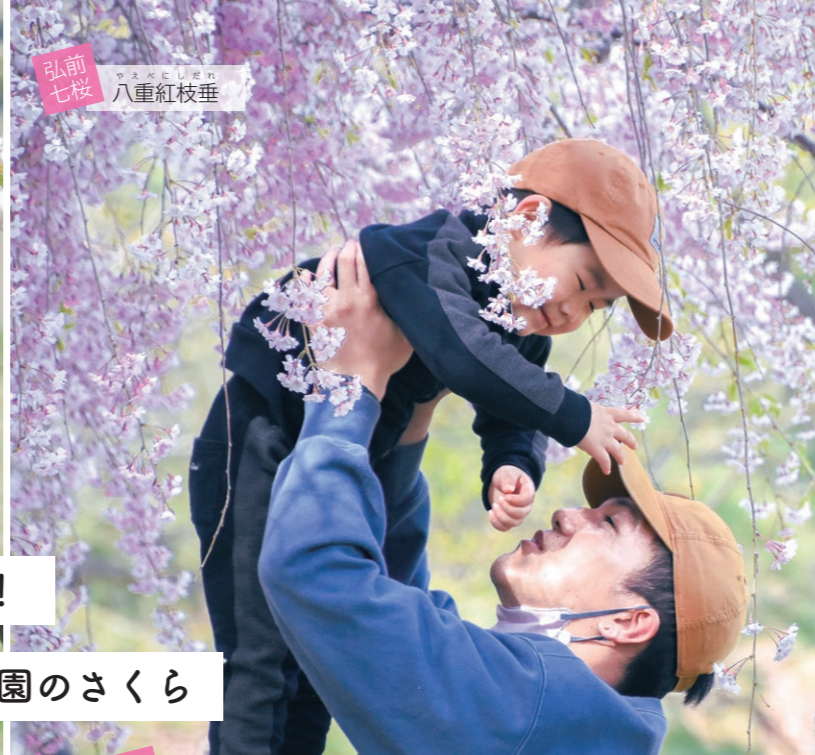
弘前七桜 八重紅枝垂