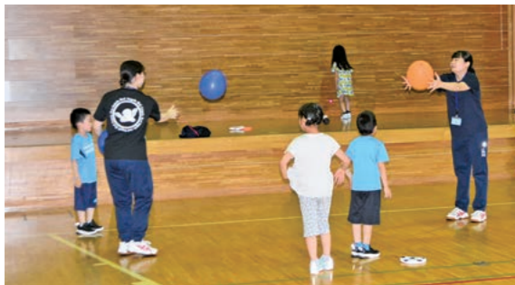
6月17日 千年交流センター（原ヶ平5丁目）

ボ ランティア活動を始めきっかけづくりとして、7人の高校生が参加。学生は、ボランティアの心構えを学んだうえで、初めてのボランティア活動に一生懸命取り組んでいました。