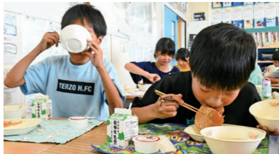
6月27日 第三大成小学校（富田町）

県 産食品を多く使った給食が、6月の「食育月間」に合わせて、市内小・中学校に提供されました。児童たちは、栄養教諭の話聞いた後、「おいしい！」と元気いっぱい給食を頬張りました。