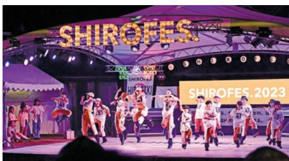
7月2日 星と森のロマンピア（水木在家字桜井）

子 どもから大人まで楽しめるイベント「SHIROFES.®2023」を6月30日から7月2日まで開催。レベルの高いダンスパフォーマンスに、多くの来場者が盛り上がりました。