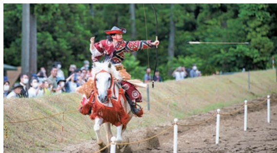
6月25日 高照神社馬場跡（高岡字獅子沢）

伝 統武芸である「流鏝馬（やぶさめ）」を開催。華やかな装束に身を包んだ射手が、馬に乗りながら的を狙い、放った矢が命中すると、観客からは大きな歓声や拍手が沸き起こりました。