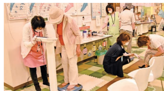
7月9日 ヒロコ（駅前町）

今 年は「めざそうよ 健康ながいき 健康都市弘前」をテーマに開催しました。入場者は、運動機能チェックや骨密度測定などを受け、健康意識を高めていました。