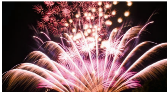
6月17日 岩木川河川敷

夏 の始まりを告げる約1万発の花火が、夜空を鮮やかに彩りました。会場では約50店の露店が並び、花火とグルメを堪能する観客で賑わいを見せていました。