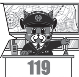
消防犬 火けしくん

11月9日の「119番の日」にちなみ、119番通報を受信してから消防車両が出勤するまでの流れを学べる親子見学会を開催します。