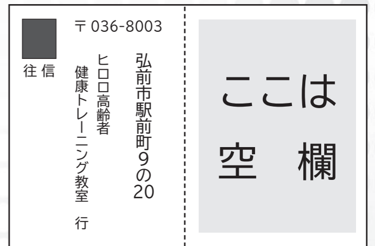
▲応募はがき記入例(往信面)

▼その他 ロマンピア(☎84-2236)や温水プール石川(☎49-7081)でも実施しています。申し込み方法が異なりますので、詳しくは各会場にお問い合わせを。※令和6年度の予算成立状況によっては、開催を取りやめる場合があります。