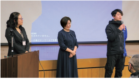
3月9日 中央公民館岩木館大ホール（賀田1丁目）

今 年度末で任期が満了となる岩木地区地域おこし協力隊員など4人が活動内容や成果を報告。活動を通して得られたことを振り返り、これからの展望や夢を語っていました。