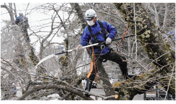
2月20日 弘前公園（下白銀町）

春 の訪れを前に、市職員がさくらの剪定を実施。剪定ばさみなどで枝を落とし、切り口に癒合剤を施しました。また、当日は園内のマンサクが史上最も早い開花を迎え、春の兆しを告げていました。