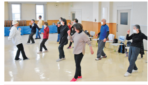
3月4日 温水プール石川（小金崎字村元）

初 心者でも楽しく踊れるダンス教室を65歳以上の市民に向けて開催。参加した12人は、途中休憩をはさみながら1時間のレッスンで振り付けを覚え、クールにダンスをキメていました。