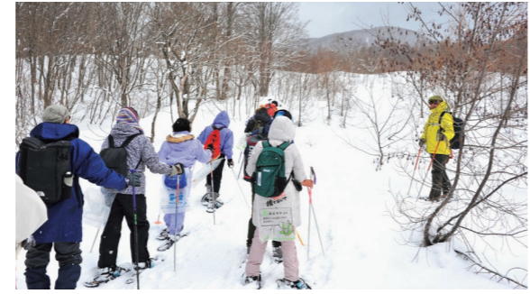
3月10日 岩木地区（常盤野字湯段范）周辺

冬 の雪深い岩木山麓で、スノーシュー（西洋かんじき）を着用してのハイキング体験を開催。参加した13人は雪上での山歩きを楽しんだ後、温泉でじっくりと体を温め、疲れを癒していました。