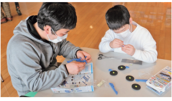
3月3日 弘前地区環境整備センタープラザ棟（町田字筒井）

小 学生を対象にトイドローンの操縦やソーラーカー作り、キャンドル作りの無料体験教室を開催。参加した児童はトイドローンの的当てゲームや工作などに夢中になって遊んでいました。