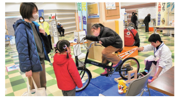
2月23日 ヒロロ（駅前町）イベントスペースほか

市 民活動団体など45団体が集まって、ブース展示や発表などを行いました。来場者は出展者との交流や体験を交えながら、市民活動に触れるひとときを楽しんでいました。