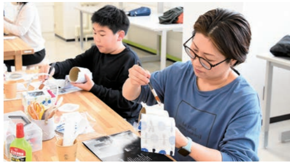
3月16日 弘前文化センター（下白銀町）

厚 紙（カルトン）で作った箱に、紙や布を貼って仕上げるフランスの伝統技法「カルトナージュ」の体験教室を開催。参加した親子は、会話をしながら制作に取り組んでいました。