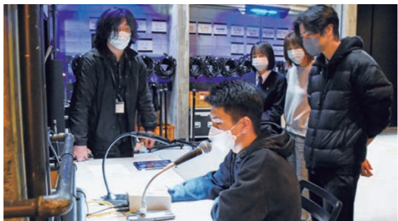
3月25日 市民会館（下白銀町）大ホール

市 民会館で、舞台装置など機械の使い方を学ぶ講座を開催。参加者は、音響反射板を動かす様子を間近で見たり、実際に機械やマイクを操作したりして、知識を深めていました。