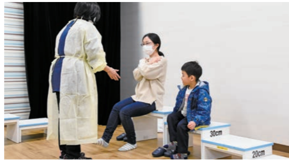
3月16日～17日 ヒロコ（駅前町）3階

楽 しく健康に暮らすコツを見つけるきっかけ作りを目的とした本イベント。QOL 健診の受診者は、先生や保健師から結果を聞きながら健康状態を確認し、生活習慣の振り返りに役立てていました。