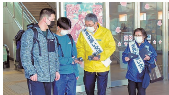
4月10日 JR弘前駅（表町）中央口、城東口

交 通事故を防止することを目的に街頭啓発活動を実施。参加者は、街ゆく人に交通安全のチラシやグッズ等を配布し、飲酒運転ゼロと交通事故ゼロを呼び掛けていました。