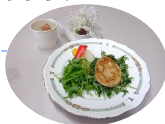
調理例 (昨年の教室より)