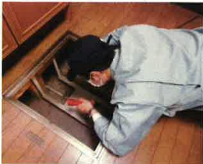
「土台・床組、基礎」調査の様子