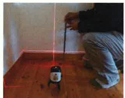
「床の傾きを計測する」調査機器