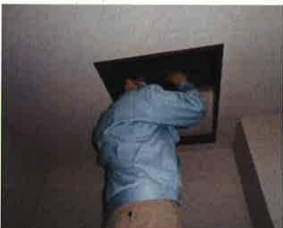
「小屋組・梁」調査の様子