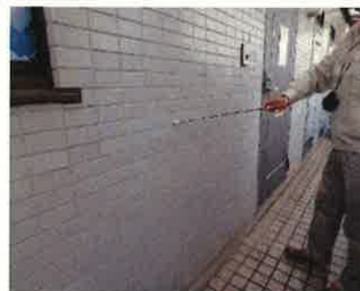
「外部（外壁）」調査の様子