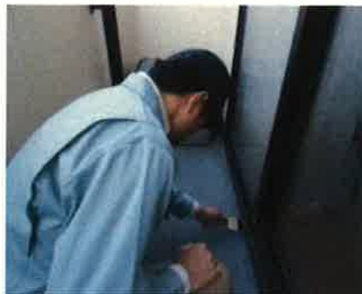
「外部（バルコニー）」調査の様子