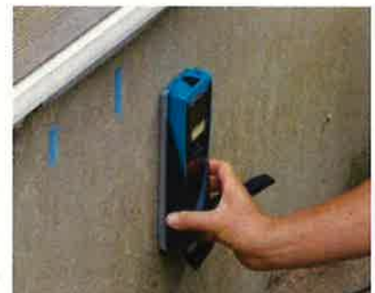
「基礎配筋」の調査機器