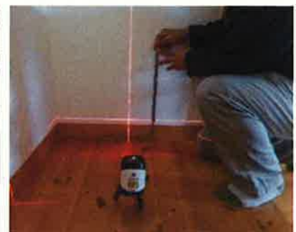
「床の傾きを計測する」調査機器