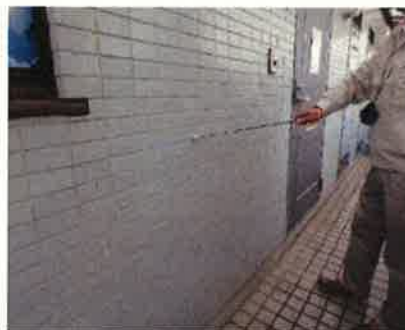
「外部（外壁）」調査の様子