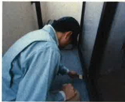
「外部（バルコニー）」調査の様子