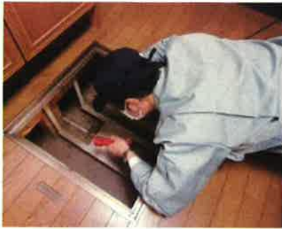
「土台・床組、基礎」調査の様子