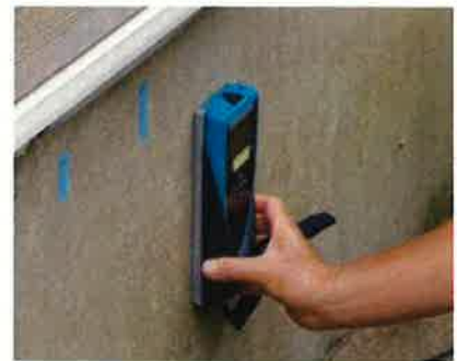
「基礎配筋」の調査機器