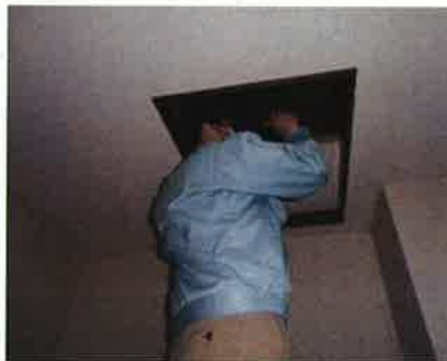
「小屋組・梁」調査の様子