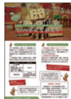
オフィス町内会 加入案内

会員に対し、それぞれの事業所等から出るごみの減量化・資源化の取り組みを呼びかけ、支援することとし、古紙類については、「オフィス町内会」を活用し、再資源化に積極的に取り組むほか、市が発信する情報を参考に、事業系ごみの排出ルールを理解し、ごみの適正排出に努めることとしています。