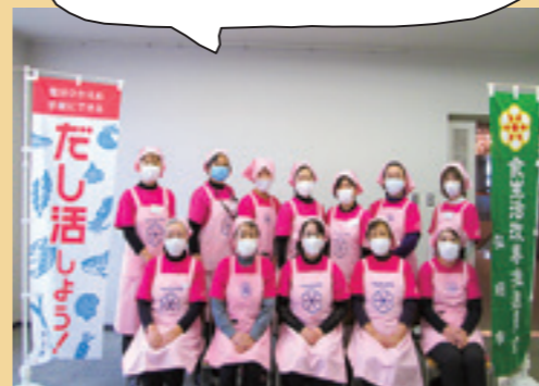
弘前市食生活改善推進委員会役員の皆さん