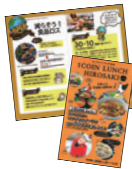
1コインランチ弘前

同社が発行する、津軽エリアの飲食店の情報を掲載したクーポンガイドブック「1コインランチ弘前」などの出版物に、市が作成するごみの減量化・資源化に関する情報を積極的に掲載することとし、これまでに、「食品ロスの削減」や「エコなテイクアウト」を呼びかける記事掲載を行うなど、周知に努めています。