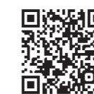
ひろさきリユース 促進掲示板

このほかにも、パソコンやスマートフォンを使わずに利用できる「ひろさきリユース促進掲示板」や「衣類回収ボックス」の設置など、リユース活動を推進していますので、こちらもぜひご覧ください。