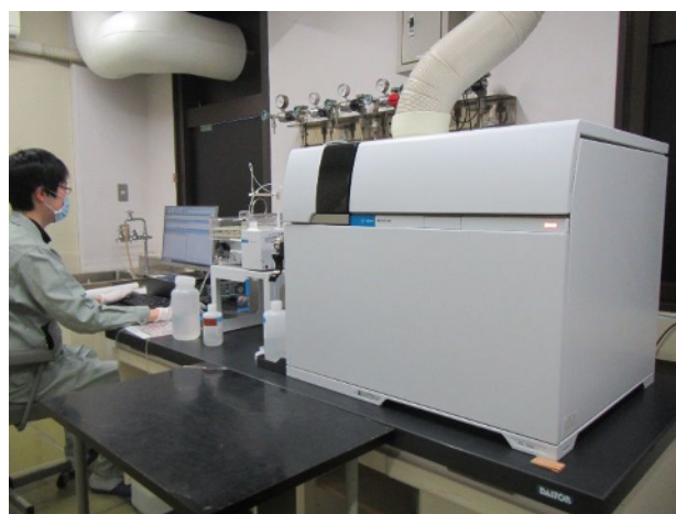
誘導結合プラズマ質量分析計（金属類の測定）