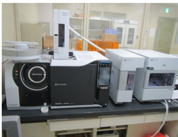
ガスクロマトグラフ質量分析計（カビ臭等の測定）

自己精度管理に取り組むとともに、環境省が実施する水道水質外部精度管理に参加し、検査精度の向上に努めています。