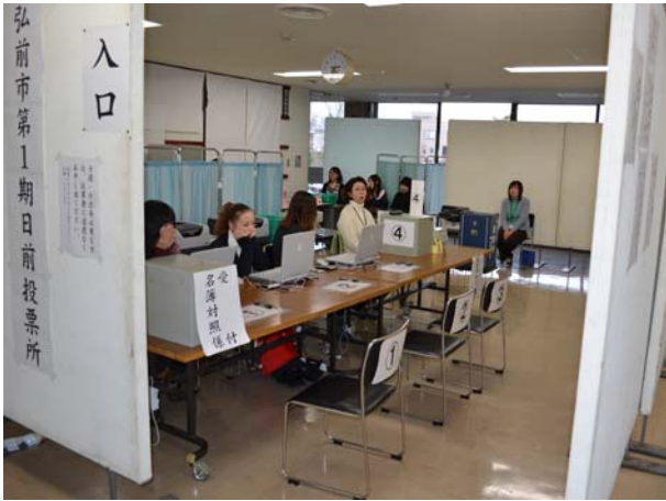
第1期日前投票所（弘前市役所）