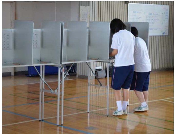
北辰中学校における模擬投票