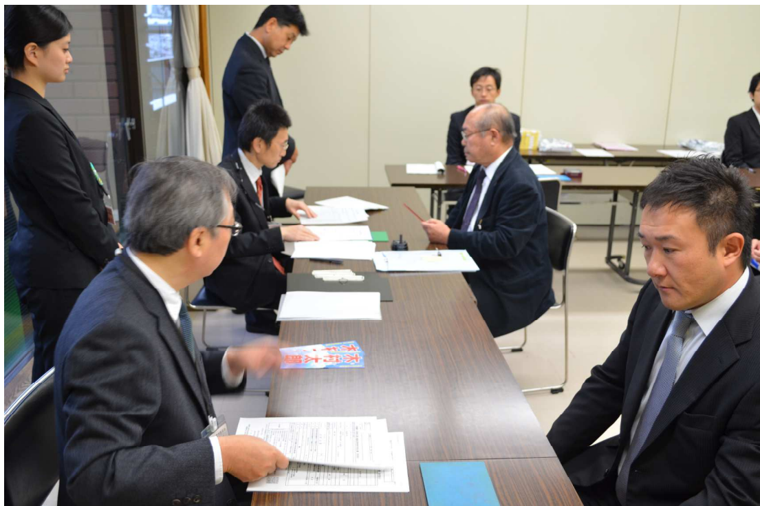
投票管理者事務打合会