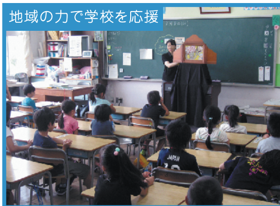
ボランティアによる読み聞かせ