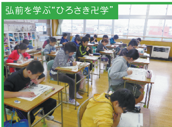
弘前に関するクイズに挑戦