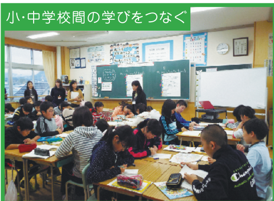
中学校教員による小学生指導