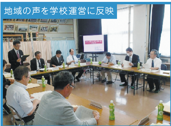
学校運営連絡協議会