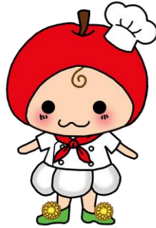
青森県学校栄養士協議会 食育推進キャラクター あぷにん