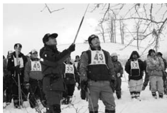
知識と技術の習得を(写真は昨年より)

農業委員会では、農業後継者りんご整枝せん定講習会兼競技会を開催します。地域間の連携と相互の研鑽を図るためにも、意欲ある後継者の皆さんの多数