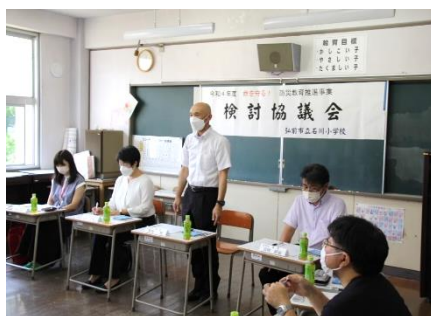
命を守る！ 防災教育推進事業 第2回検討協議会