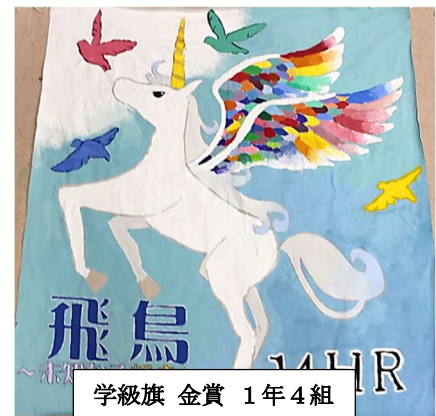
学級旗 金賞 1年4組