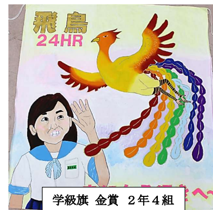
学級旗 金賞 2年4組