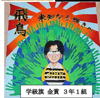
学級旗 金賞 3年1組