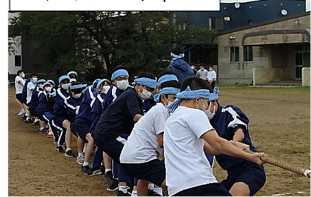
スポーツフェスティバル