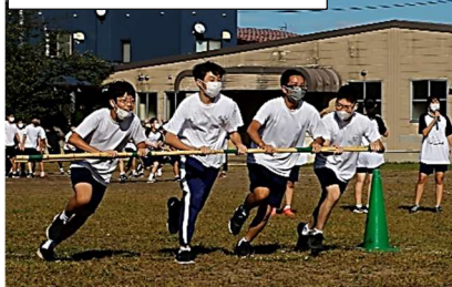
前夜祭 (生徒会企画)