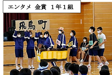
エンタメ 金賞 1年1組