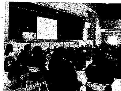
校長講話にうなづく児童(手前は引率の先生)

2月1日(月)、新年度本校への入学を予定している小学6年生148名及び保護者を対象に、本校体育館において説明会が実施されました。