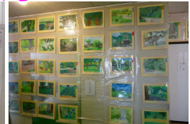
大仏公園の風景画