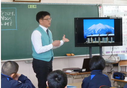
石川小・中学校から見える岩木山を取り上げました。