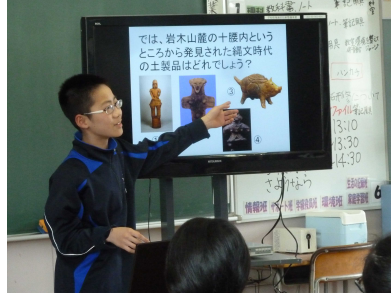
岩木山麓から発見された「いのち」も取り上げました。