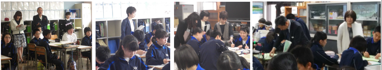
中学校の授業を参観する小学校の先生方（左から総合的な学習の時間・数学・理科）