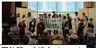
4年生白寿園訪問・交流会(11/12)