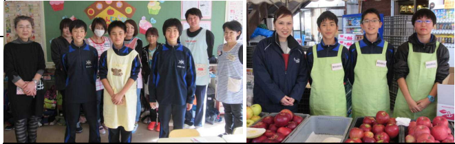
中学校1年地域職場体験学習(11/1,2)

小学校5年・中学校1年合同学習・・・総合的な学習の時間「魅力あるまちづくりプランを立てよう」、昨年度小6の時は報告会で聞く立場だった中1が職場体験についてポスターセッションを行い、その後、魅力あるまちづくりについて、小5の児童と共に4つの視点から意見交換しました。地域と連携した小中一貫キャリア教育でESD(持続可能な社会づくりの担い手を育てる教育)の視点も入っていた授業です。