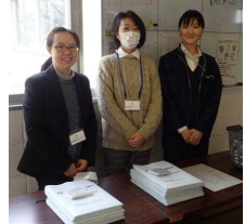
保護者・地域の方々の運営面での支援もありました

11月21日(水)、肌寒く冷たい小雨の中、平成30年度教育自立圏推進公開発表会を実施しました。市内小学校(28校)教員38名、市内中学校(15校)教員22名、弘前市教育委員会関係者27名、中南教育事務所員4名、弘前大学関係者3名、石川小・中学校保護者17名、石川地区関係者(学校運営協議会委員、地域コーディネーター、健全育成協議会委員など)24名、石川小・中学校教職員26名、計161名が参加し、有意義な公開発表会となりました。