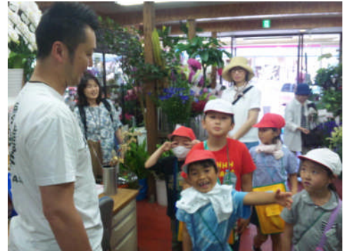
2年生町探検の学習ボランティア